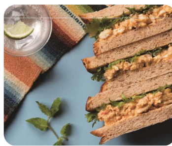
タコスミートタマゴサンド 1cut 450円

国産大豆を使用した木綿豆腐を燻製にしたスモーク豆腐はチーズのようなコクとなめらかな食感。ツンとくるわさびがアクセントになった一味違うタマゴサンドをお楽しみ頂けます。