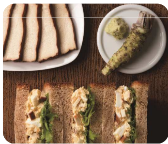
豆腐スモーク&わさび タマゴサンド 1cut 450円

株式会社ポムフードは、2016年4月博多マルイにオープンした全国初のタマゴサンド専門店「oeuf TAMACO サンド(ウフタマコサンド)」にて2016年7月19日(火)より期間限定のタマゴサンドを発売開始いたします。