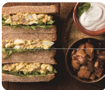
チキンカレーヨーグルト タマゴサンド 1cut 450円

ピリっとした辛みと刺激あるスパイスの香りが食欲をそそるタコスミートをオリジナルたまごフィリングに合わせたメキシカンなタマゴサンドです。