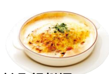
オムライスドリア