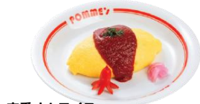
定番オムライス (チキン入り)