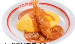
ジャンボエビフライの ホタテトマトクリームソース オムライス