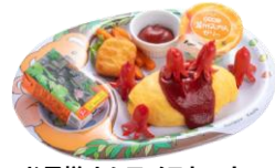
お子様オムライスセット