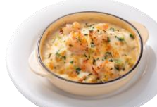
エビとブロッコリーの オムライスドリア