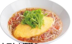
トマトと鯉節の 和風スープオムライス (梅肉添え)