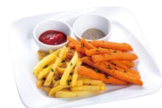
じゃがいもフライ& さつまいもフライ