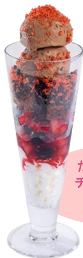
たっぷりベリーの チョコトールパフェ