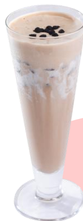
クリームチョコ &コーヒー