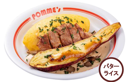
かぼちゃinオムライسدリア 数量限定