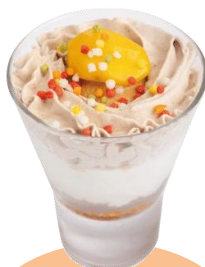
ミニマロンパフェ