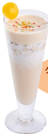
クリームマロン&コーヒー