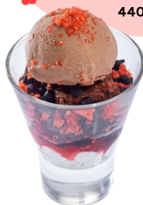
たっぷりベリーの チョコミニパフェ