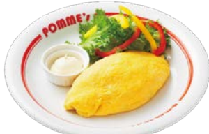
野菜マヨネーズオムレツ SS 糖質 約1.6g 約217kcal. S 糖質 約2.8g 約256kcal.