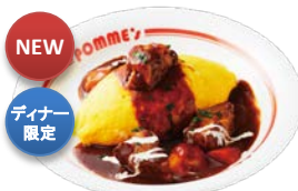
プレミアムビーフシチューオムライス