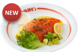
サーモンとアボカドのポムドレオムライス