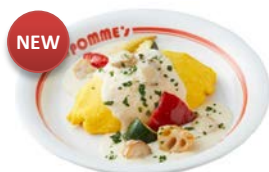
ホタテとゴロツと野菜のクリームソースオムライス