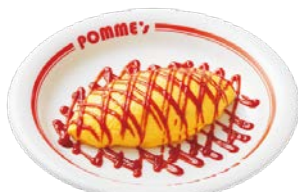
糖質OFFケチャップオムレツ SS 糖質 約0.1g 約210kcal. S 糖質 約2.2g 約216kcal.