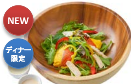
サラダチキンサーモンオムライス