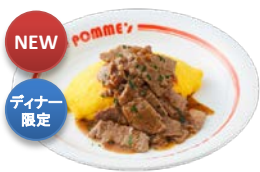
カットステーキオムライス