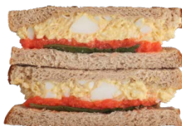
明太子タマゴサンド 1個 400円(税込)