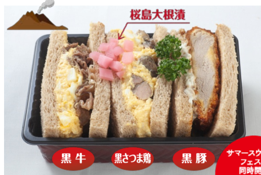
鹿児島島の黒シリーズサンドセット 3種入 1,300円(税込)

こだわりの鹿児島産 黒牛・黒さつま鶏・黒豚。 黒シリーズを贅沢にセットした逸品。