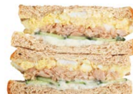
ツナマヨきゅうりタマゴサンド 1個 400円(税込)