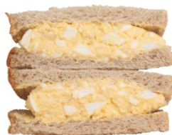
TAMACOサンド 1個 360円(税込)