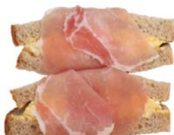
生ハムタマゴサンド 1個 400円(税込)