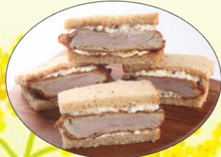
タルタルヒレカツサンド タルタルソースとの相性抜群！ ¥1,200