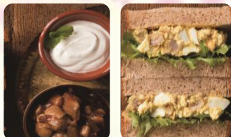
チキンカレーヨーグルトタマゴサンド 1cut 500円