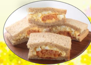
ケチャップライスタマゴサンド 自慢の定番ケチャップを タマゴフィリングでサンド ¥1,050