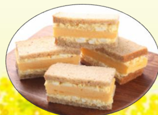
タマゴ&タマゴサンド 厚焼きタマゴをタマゴフィリングで サンドしたダブルサンド ¥1,050