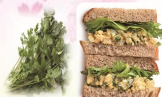
フレッシュパクチータマゴサンド 1cut 400円