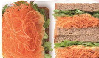
たっぷりキャロットタマゴサンド 1cut 400円

oeuf TAMACO サンド(ウフタマコ サンド)は、 オリジナル玄米パンに和風や洋風、変わり種の タマゴフィリング、水耕栽培で育てられた 無農薬・低細菌のフリルレタスをサンドしました。 パンオブザイヤー2017で金賞を受賞した『TAMACOサンド』を はじめ、人気のタマゴサンドも勢ぞろい！ 今回は『気になるタマゴサンド』12種類と肉厚！(びっくり)の ヒレカツサンドのスペシャルサンドもご用意！ この機会にお気に入りのタマゴサンドを見つけてください。