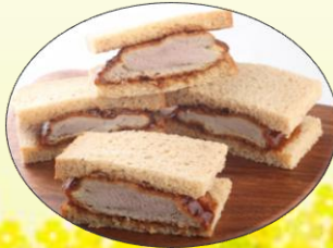
ソースヒレカツサンド 肉厚は厚切り豚ヒレ肉 ¥1,200