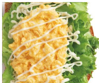
たっぷりフリルレタスタマゴサンド 1cut 390円