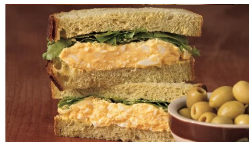
タマコのオリーブパン 1cut 330円