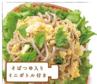
日本そばタマゴサンド 1cut 420円