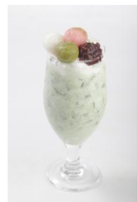
アイス白玉あずきのお抹茶ラテ 610円(税込)