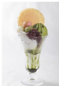
知覧茶ジェラートのあずき白玉パフェ 780円(税込)