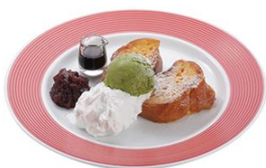
知覧茶ジェラートのフレンチトースト 700円(税込)