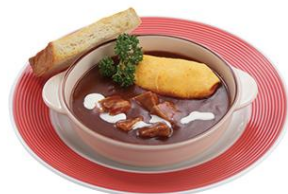
ビーフシチューのオムレツのせ 980円(税込)

たまごのトロトロ具合も絶妙な目にも鮮やかなドレープオムライスです。ソースはカレーソース・ハッシュドビーフも用意しています。