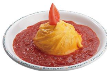
トマトソースオムライス 780円(税込)

ご注文いただいてから焼き上げる、ふわふわぶるぶるの厚焼きたまご。からしマヨネーズとデミグラスソースがたまごの甘味を引き立てます。