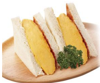
wa TAMACOのたまごサンド 1,400円(税込)

oeuf de wa TAMACO(ウフ デ ワ タマコ)は、こだわりたまごで作る“たまご料理”をご提供する和風と洋風を融合させたカフェです。 ふわふわ厚焼きたまごをはさんだwa TAMACOのたまごサンドやオムライス、知覧茶やほうじ茶を使った和のデザートや抹茶やあずきのドリンクをご提供いたします。